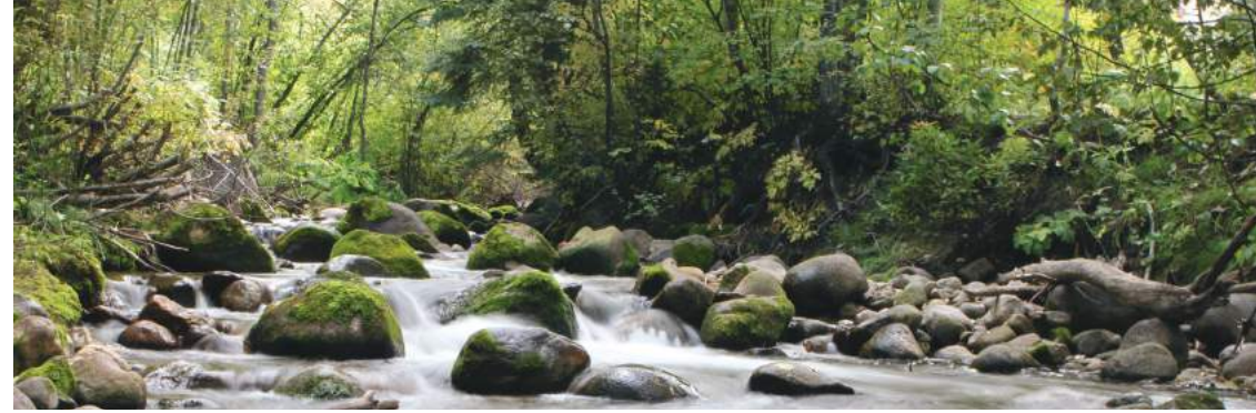
Entendre la voix de Dieu, sa Parole